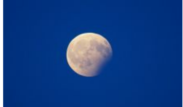
Aufnahme der partiellen Mondfinsternis am 7. August 2017 vom Bismarckturm aus gesehen