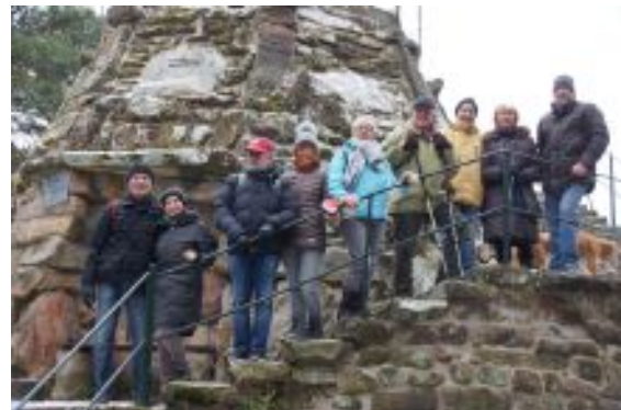
Oben: Der Vorstand auf seiner Wanderung im Januar 2017 an der Kaiser-Wilhelm-Höhe

1897 wurde zum 100. Geburtstag des Kaisers ein Medaillon mit seinem Kopf angebracht. Es ging verloren und wurde 2003 ersetzt.