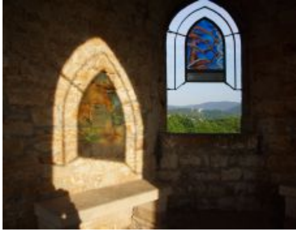
Morgenlicht im Flaggenturm